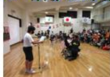
少人数の落ち着いた学習環境と きめ細やかなサポート