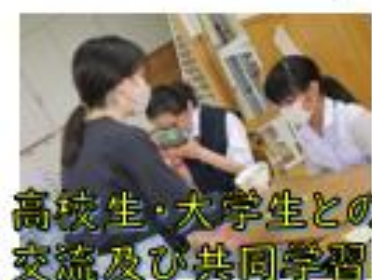
高校生・大学生との 交流及び共同学習