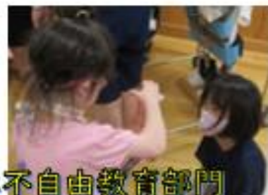
肢体不自由教育部門 (イエロー部門)との学習